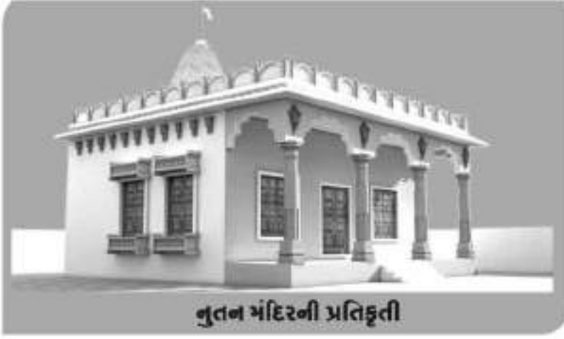
નવનિર્માણ મંદિરની પ્રતિકૃતિ

પહેડી અને વિશલમાતા અને જ્ઞાનાયેની પ્રતિમાના ચડાવા તા. ૧૯-૧૧-૨૦૧૭